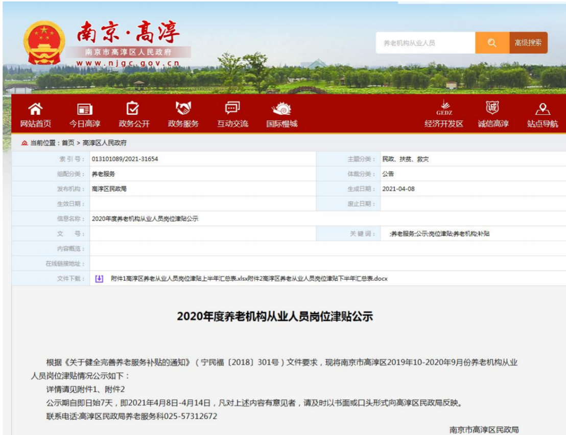
南京市高淳区养老服务机构从业人员岗位津贴上半年汇总表